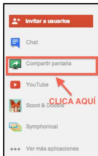
Imagen 2. Detalle del icono “Compartir pantalla”

En la ventana emergente que aparecerá sobre la pantalla de la videollamada múltiple, la/el estudiante debe seleccionar el archivo con las diapositivas.